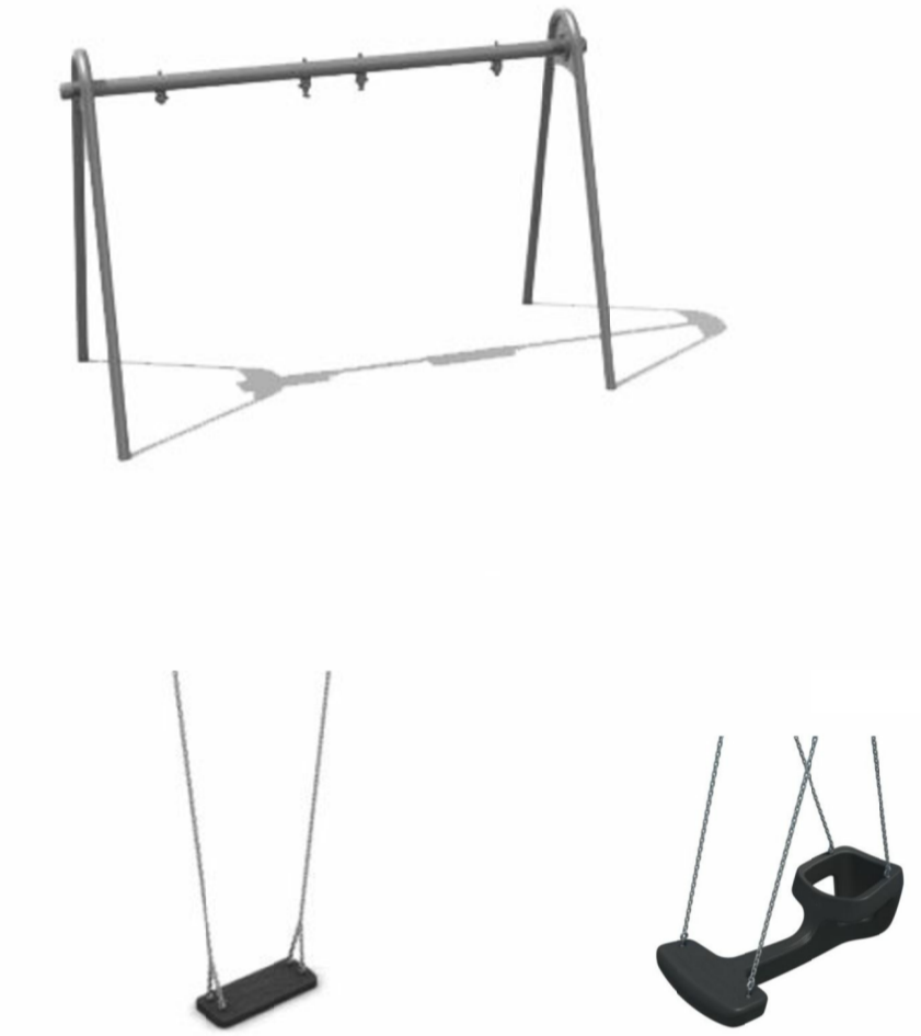
Vald gungställning och gungsitsar