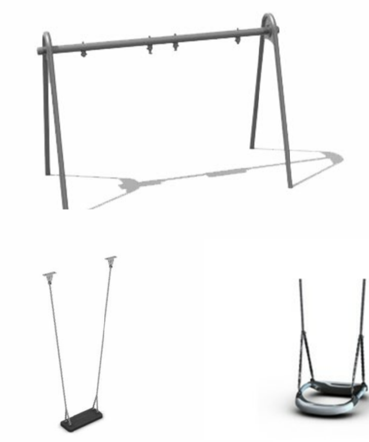
Vald gungställning och gungsitsar