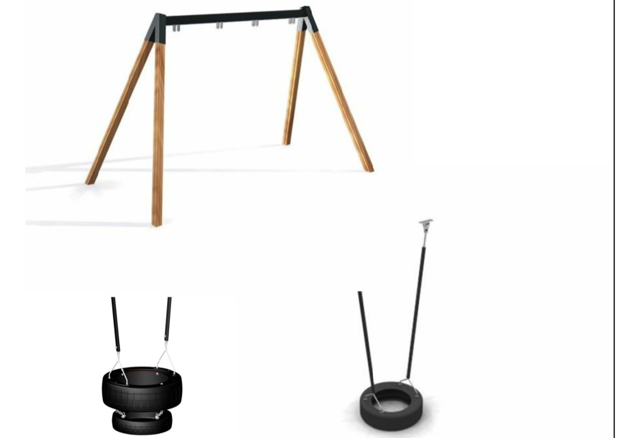
Vald gungställning och gungsitsar